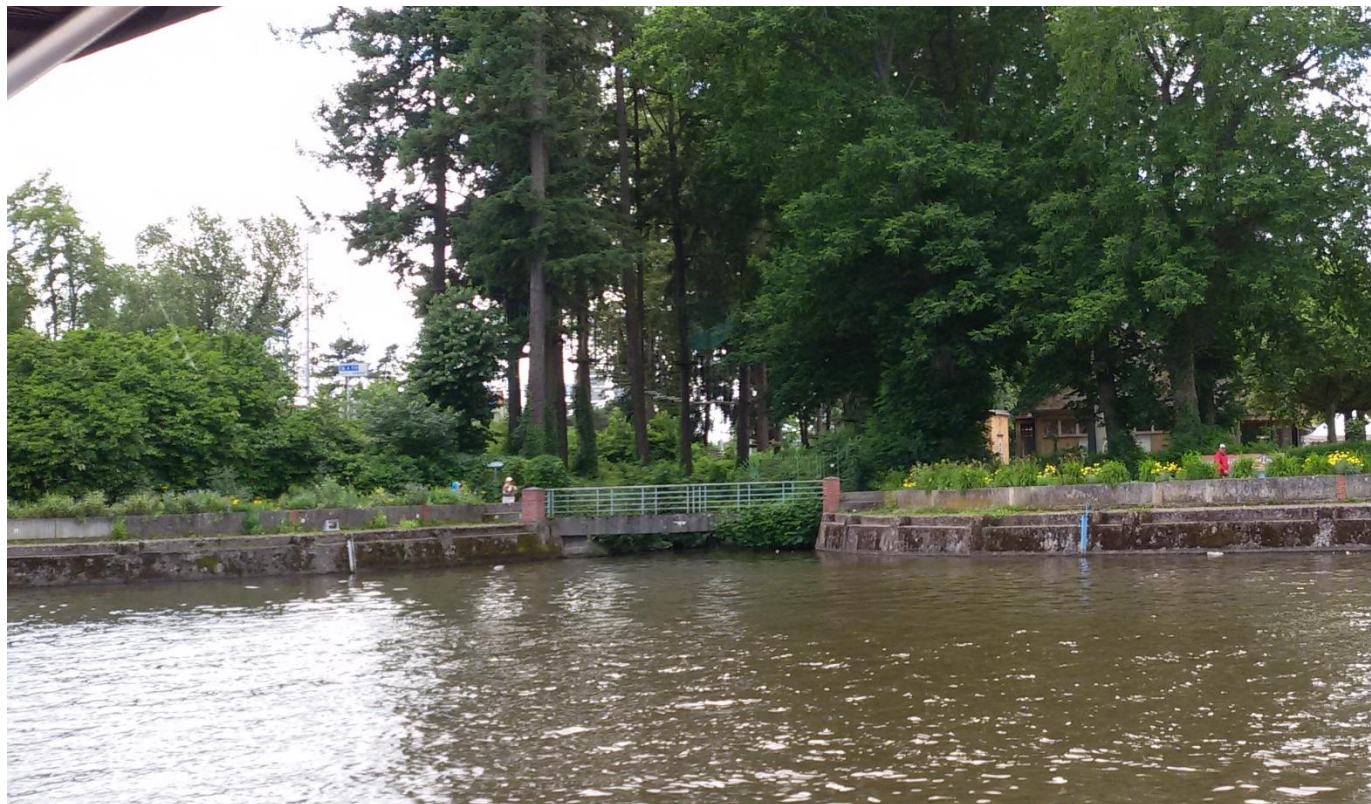
Etat actuel de la confluence Allier/Sarmon